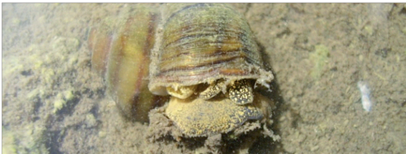
Bahenka živorodá ( Viviparus contectus ) z tůně Žitina

text a foto David Macháček priroda.kostomlaty@seznam.cz